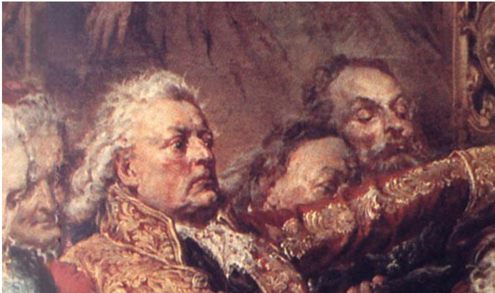
Adam Poniński – zdrajca – marszałek sejmu rozbiorowego przekupiony przez Rosję

Kraje zaborcze domagały się od Polaków, aby zatwierdzili rozbiór i sami zrezygnowali z terenów zagarniętych przez sąsiadów. W tym celu Rosjanie nakazali królowi polskiemu zwołanie w 1773 roku sejmu rozbiorowego. Niemal wszyscy posłowie zostali przekupieni przez rosyjskiego ambasadora, dlatego podczas obrad prawie nikt nie sprzeciwił się tak jawnej niesprawiedliwości. Jednym z nielicznych protestujących był Tadeusz Rejtan, ale jego protest został zignorowany.